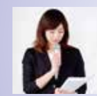
司会・式典スタッフ